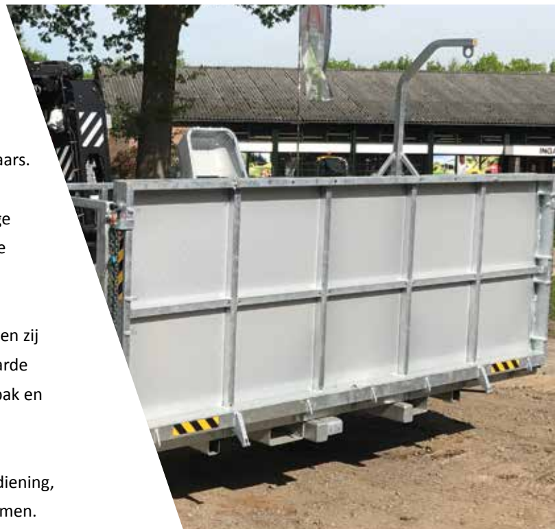
Gehele werkbak in dichte uitvoering

Maatvoering: Breedte 3,30 m x Diepte 2,40 m