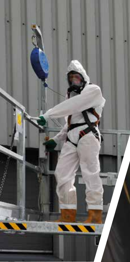
Werkbak voorzien van twee beveiligingsbeugels voor het bevestigen van de veiligheidskabel