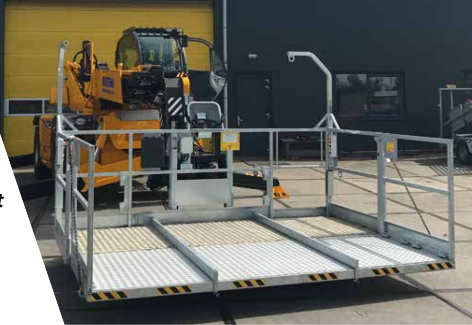
Gehele werkbak in open uitvoering

Maatvoering: Breedte 3,30 m x Diepte 2,40 m